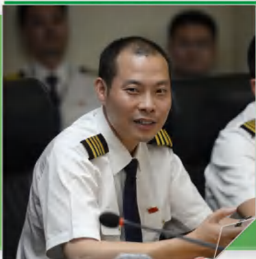
“中国民航英雄机长”刘传健

2018年5月14日，刘传健驾驶的3U8633航班突然发生驾驶舱风挡玻璃爆裂脱落、座舱释压的紧急状况，他和机组人员成功处置航班险情，驾驶飞机安全迫降成都双流机场，确保了119名旅客和9名机组人员的生命安全，创造了航空史上的奇迹。