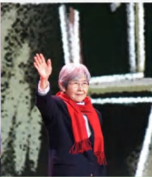
“敦煌的女儿”樊锦诗