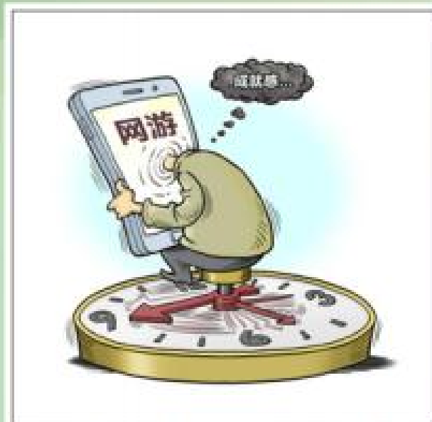
“玩掉”的时间 新华社发 程硕 作